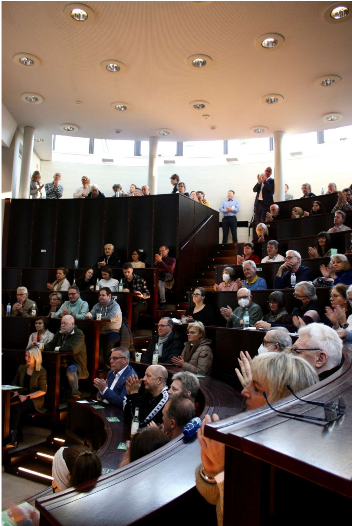
Über 200 Teilnehmer hören interessiert zu.