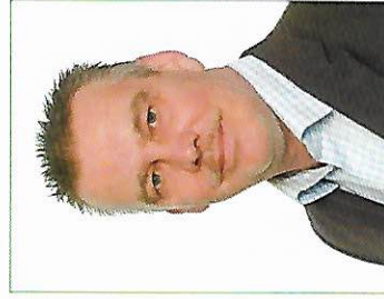
Günter Breitenberger Geschwister-Scholl-Str. 4 58300 Wetter

Wir sind Ihre Ansprechpartner. Bitte kontaktieren Sie uns!