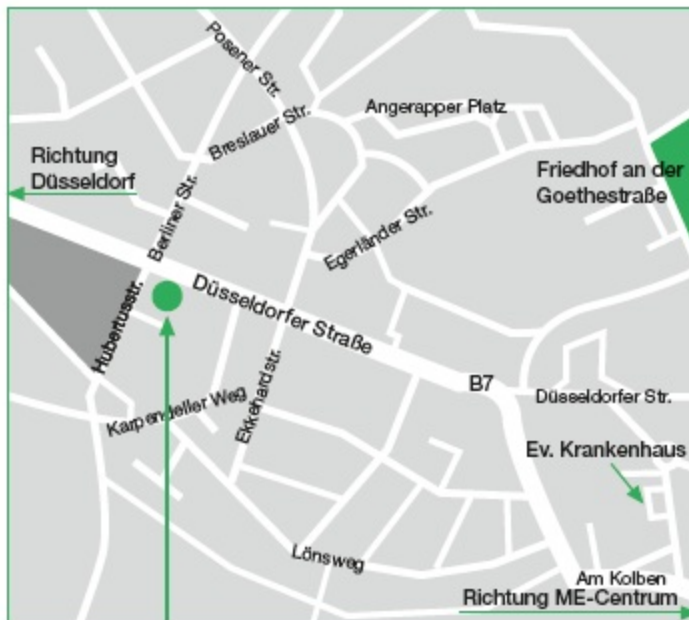
Johanneshaus der Thomas Morus Kirche, Düsseldorf Str. 154, 40822 Mettmann